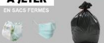
couches, masques, déchets résiduels, etc.