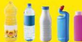
Bouteilles, flacons et bidons en plastique