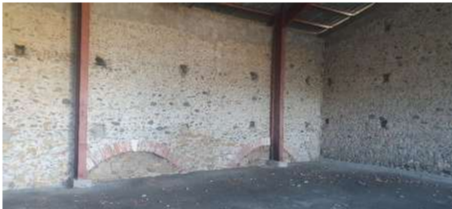
Seuls témoins d'une infime partie de la faïencerie Laroque : les voutes supérieures de deux fours enterrés.