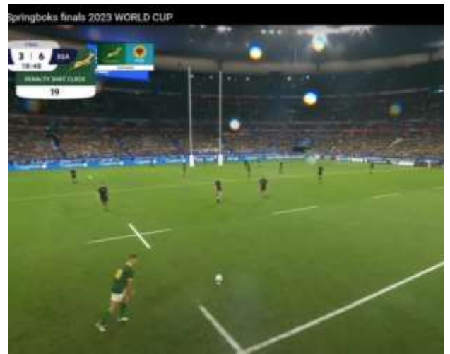
... Pollard marque une pénalité...