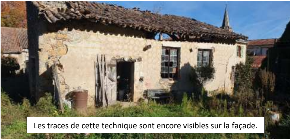
Les traces de cette technique sont encore visibles sur la façade.

Séchoir et atelier de préparation des faïences avant et après cuisson