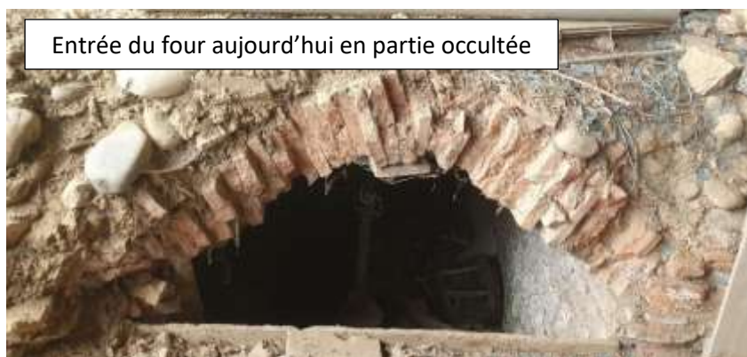
Entrée du four aujourd'hui en partie occultée