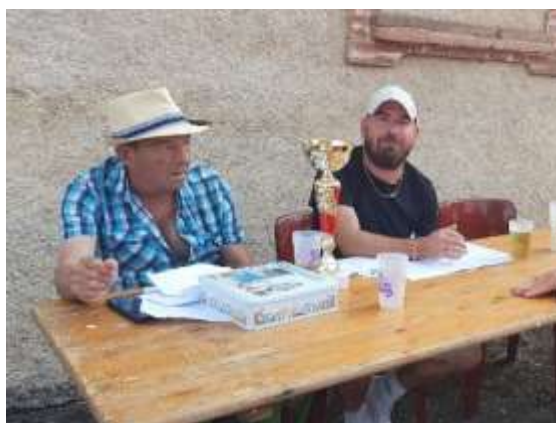
Un grand merci à Yves et Mickaël pour l'organisation des concours de pétanque.