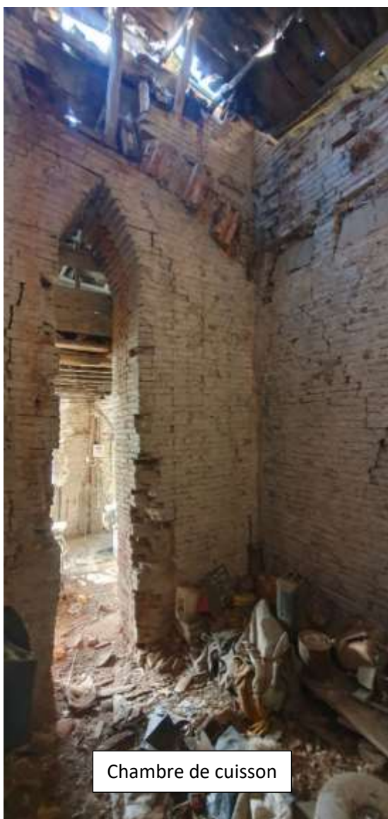
Chambre de cuisson