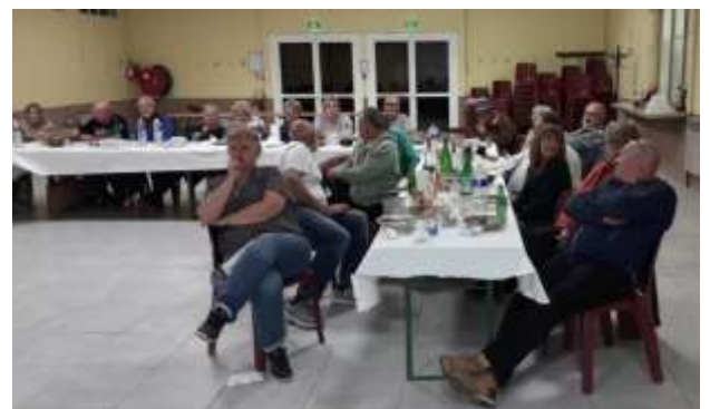
... les spectateurs n'en manquent pas une miette, ni du repas, ni du match...