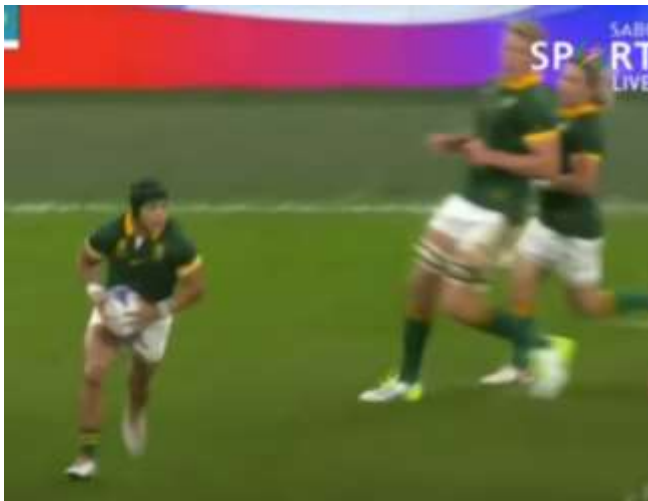
Cheslin Kolbe fulgurant s'échappe ...

Belle soirée, merci à l'Association de Chasse.