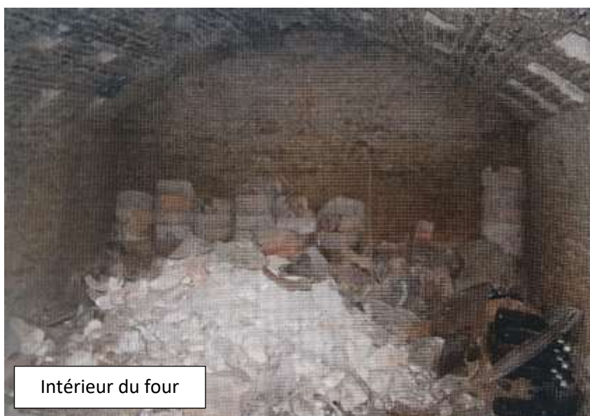
Intérieur du four