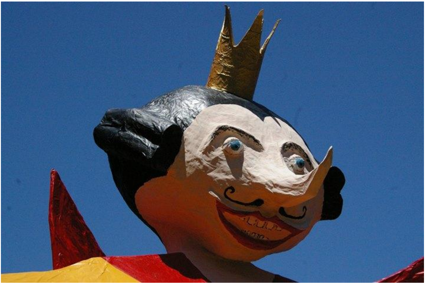
Made in Mauran ... by Pierre